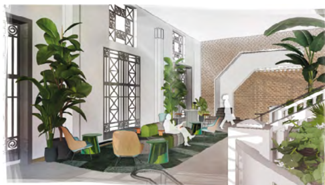
La paillote botanique du Hall de Art&Co.

Plus le concept est cohérent, est bien réalisé et génère du sens, plus la valeur de vie et d'expérience augmente et le lieu devient source de bien-être et d'émulation collective. Un concept devient bon lorsque son design est aussi capable de créer du désir et la poésie, in fine des émotions marquantes à un lieu.