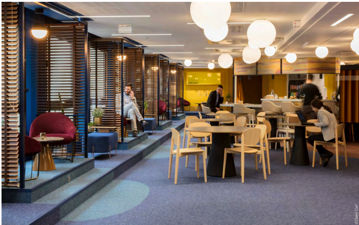
Le Velvet Club de The Line.