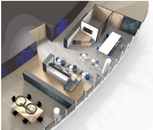
Organisation plan type