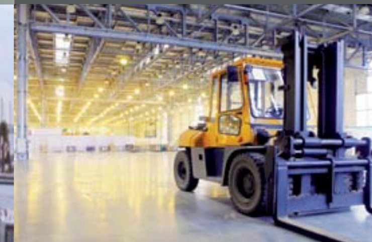
> Industriel et Logistique