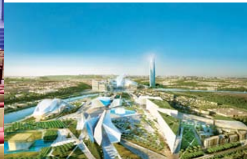
> Projet Wessal, Bouregreg