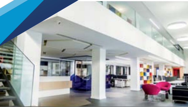
> Hall d'accueil du bureau de Casablanca