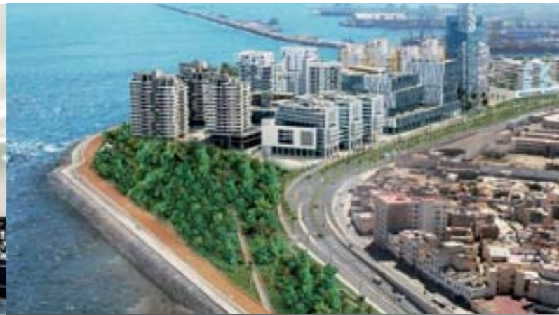
> La Marina, Casablanca